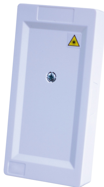
PTO - Ponto de Terminação Óptico com bandeja