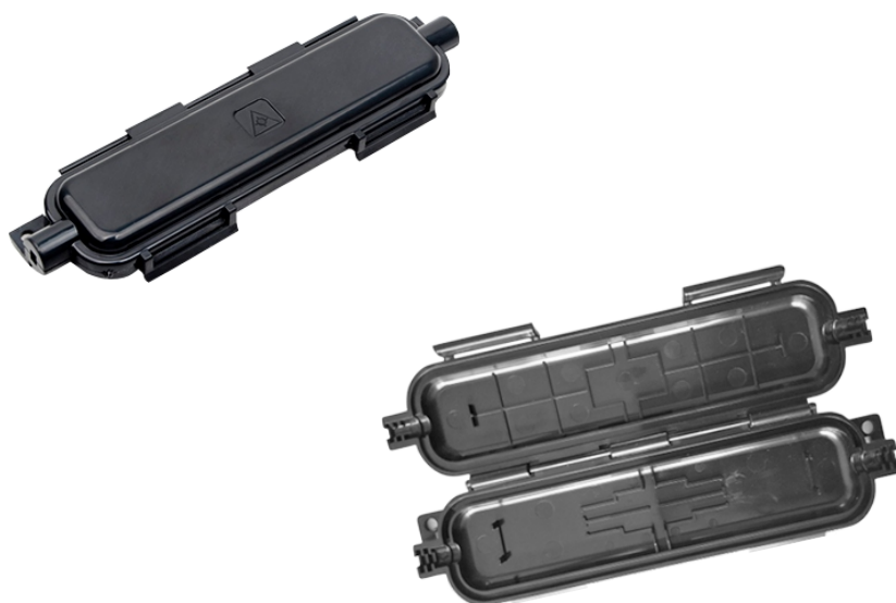
Protetor de Emenda