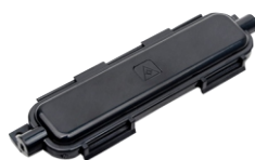
Protetor de Emenda cod.: 6.04.094