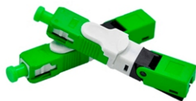
Conector Rápido SC-APC cód.: 6.04.043