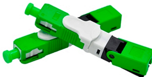
Conector Rápido 'Tipo E'