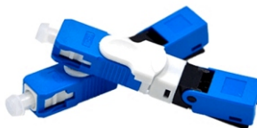
Conector Rápido SC-UPC cód.: 6.04.044